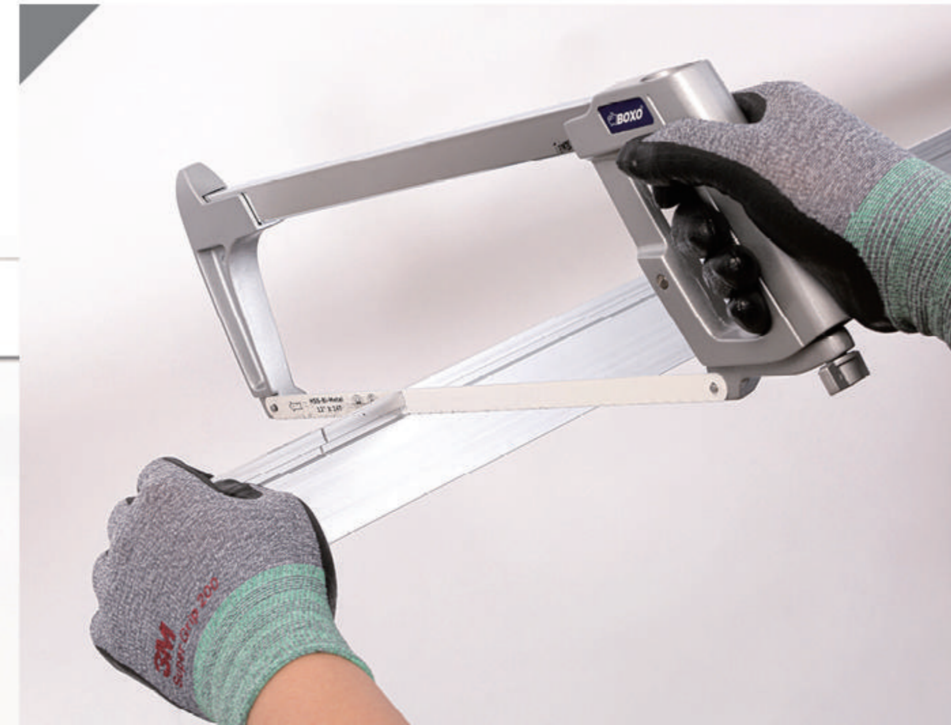
2-2 표시한 선에 따라 재단