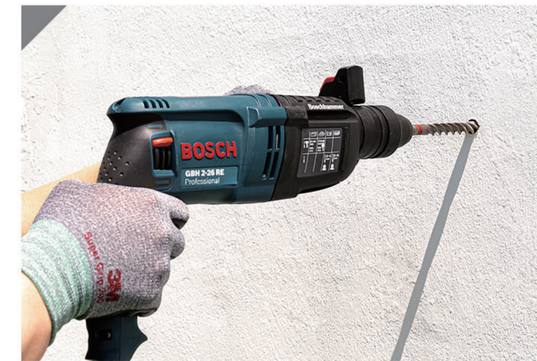
1-1 고정위치 표기 후 드릴로 구멍을 뚫는다