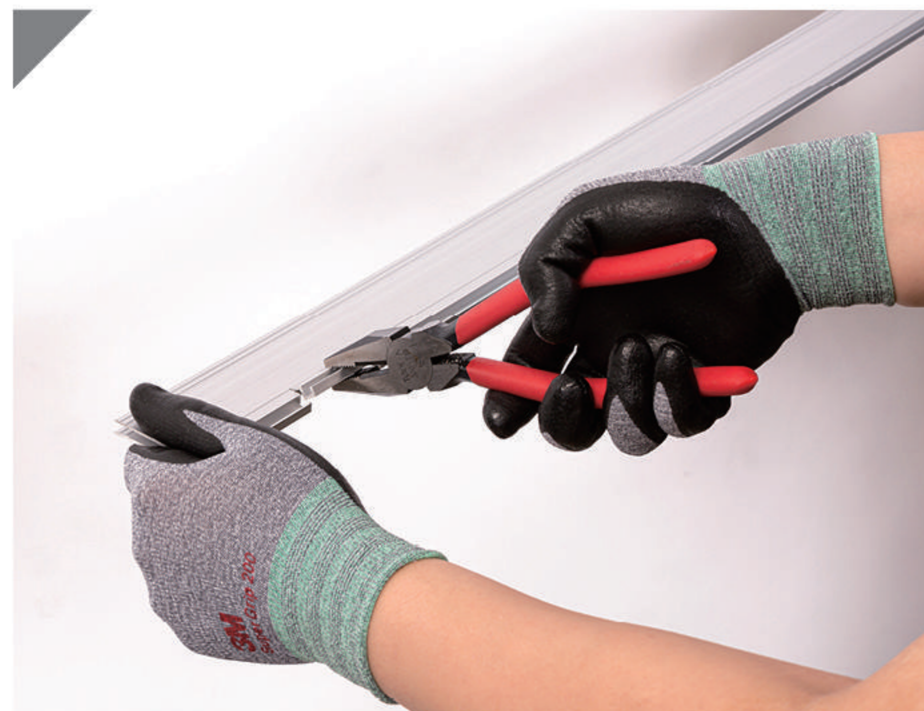
2-3 재단된 부분을 떼어냄