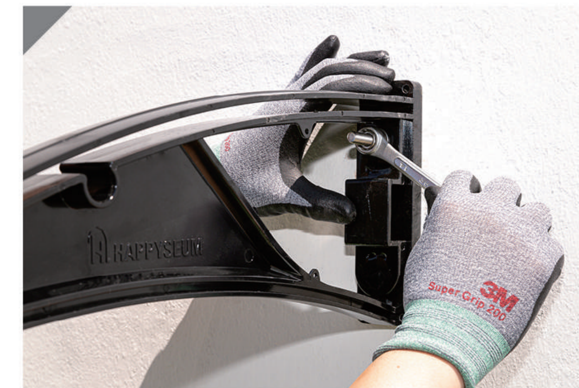
1-3 고정된 양카볼트(9)에 트러스(1) 체결