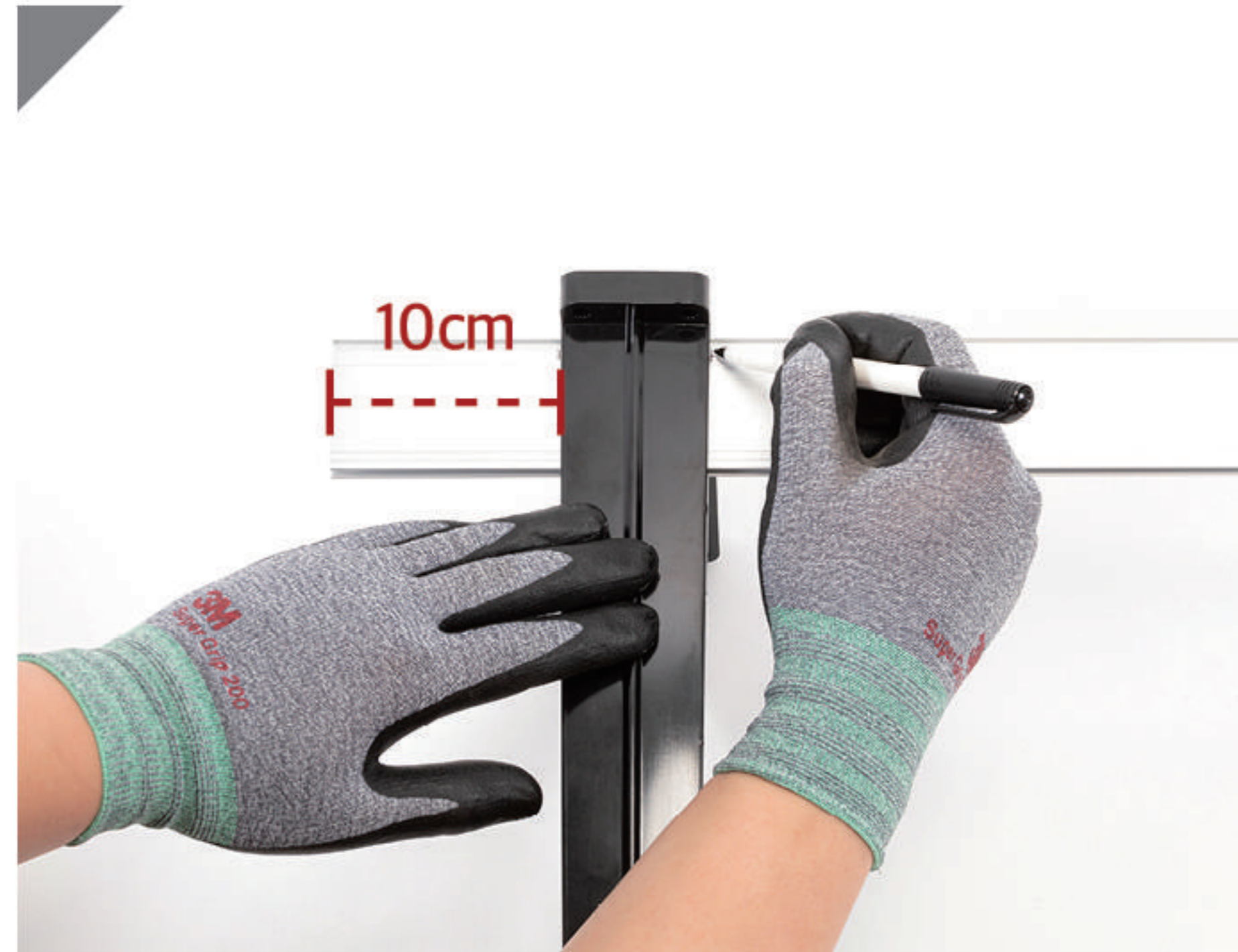
2-1 펜을 이용해 트러스간격 표시 (10cm 권장)

▶ 뒷고정대 트러스(브라켓) 간격에 맞게 재단 후, 트러스(브라켓) 밑으로 넣어 벽측에 밀착