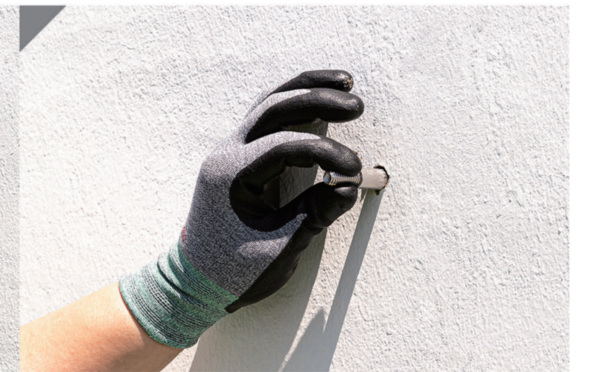
1-2 양카볼트 고정(9)