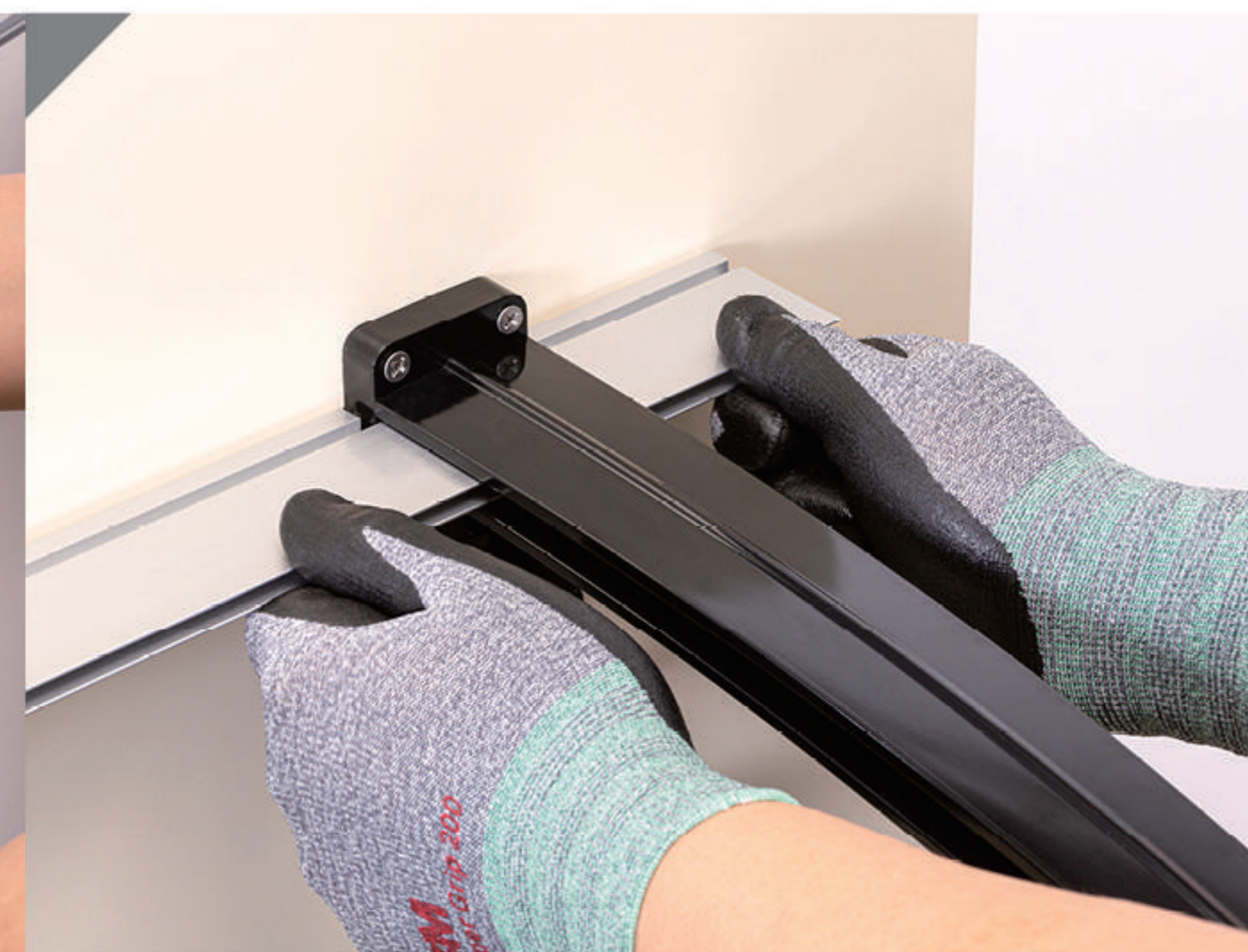
2-4 뒷고정대(3)를 트러스(브라켓)(1)에 완전히 밀어 넣음.