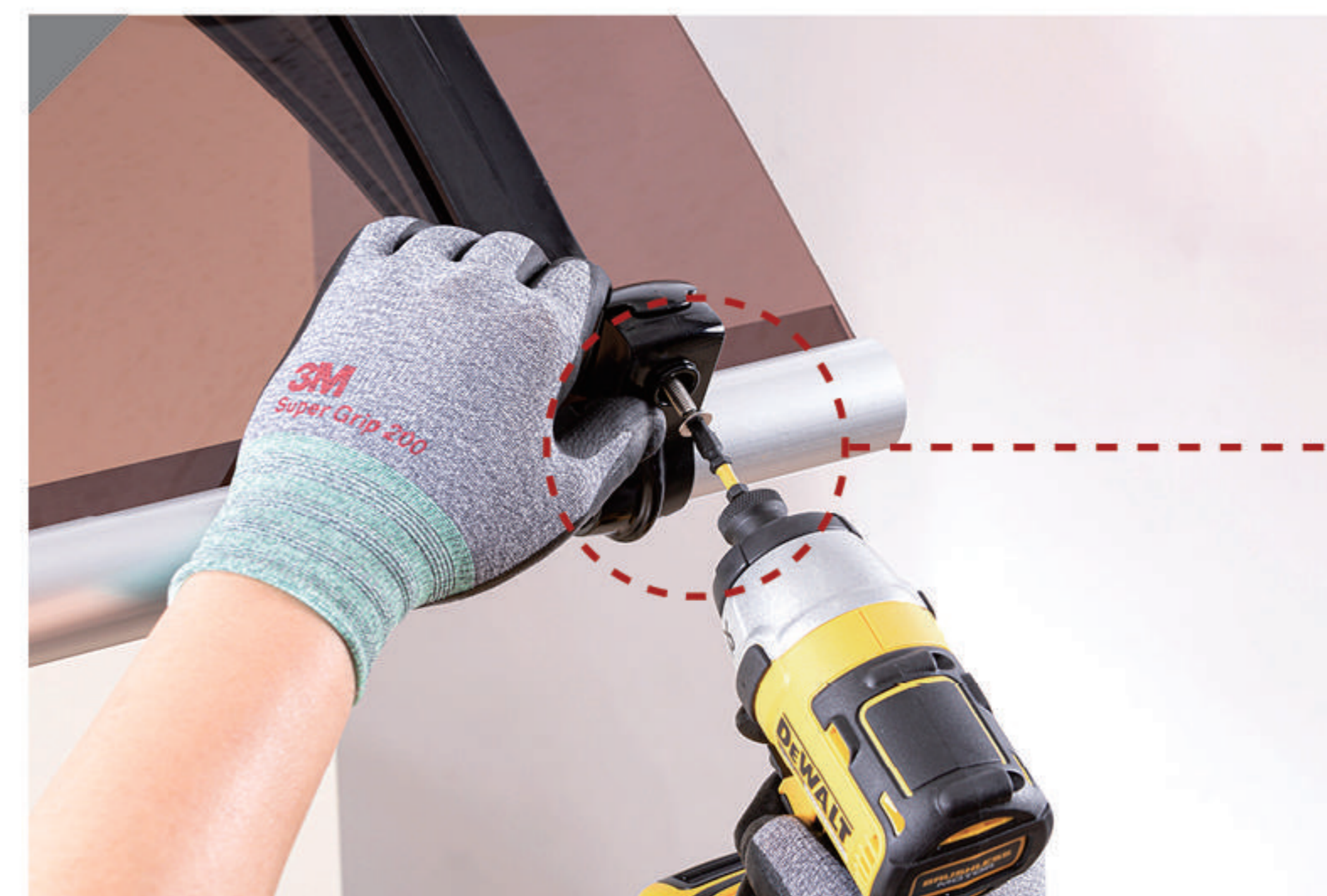
볼트너트(6)를 이용해 덮개를 덮어 고정