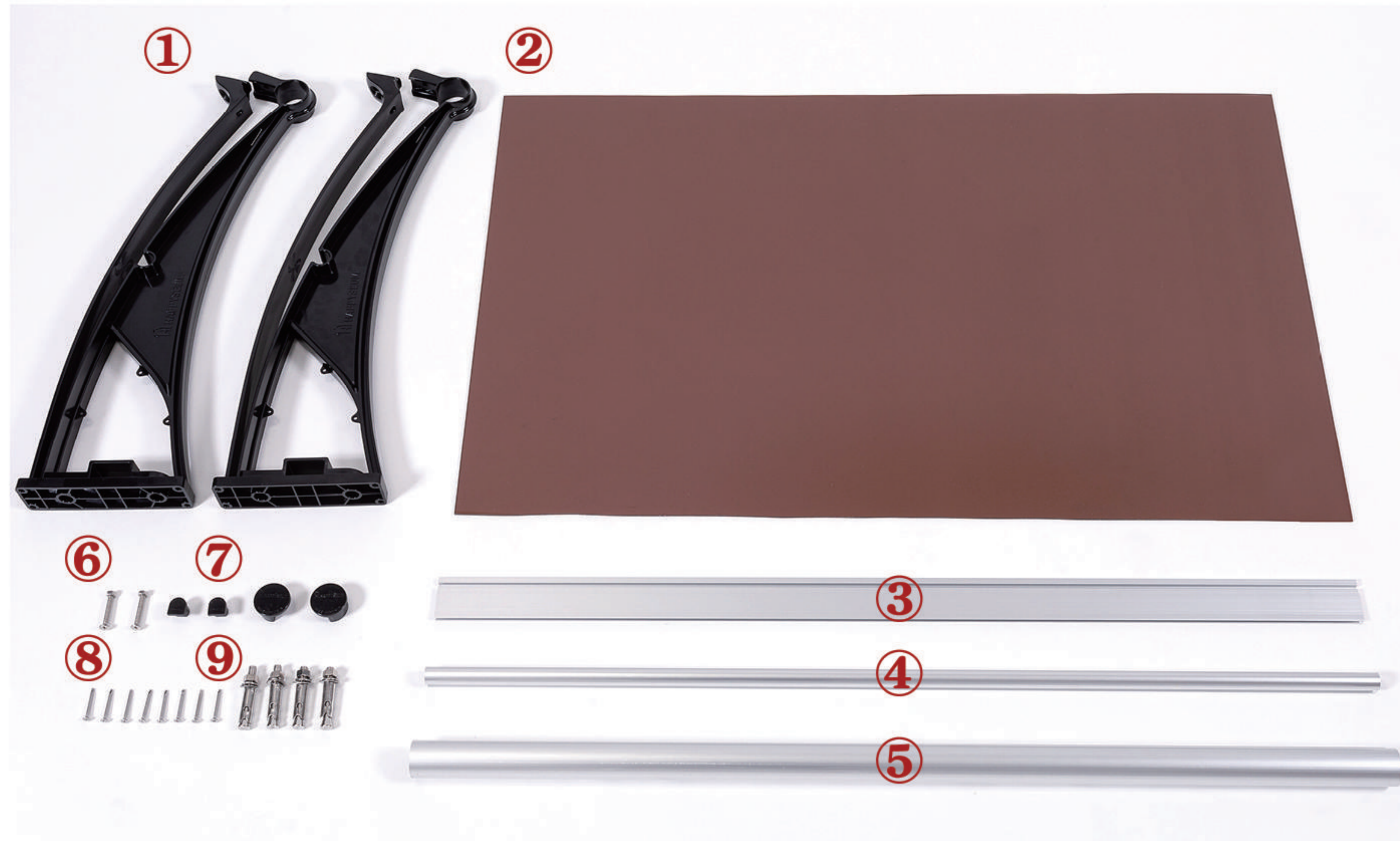
① 트러스(브라켓) / ② 폴리카보네이트 / ③ 뒷고정대 / ④ 중간지지대 / ⑤ 앞고정대 ⑥ 볼트너트 / ⑦ 고정대 마감캡 / ⑧ 고정용피스 / ⑨ 양카