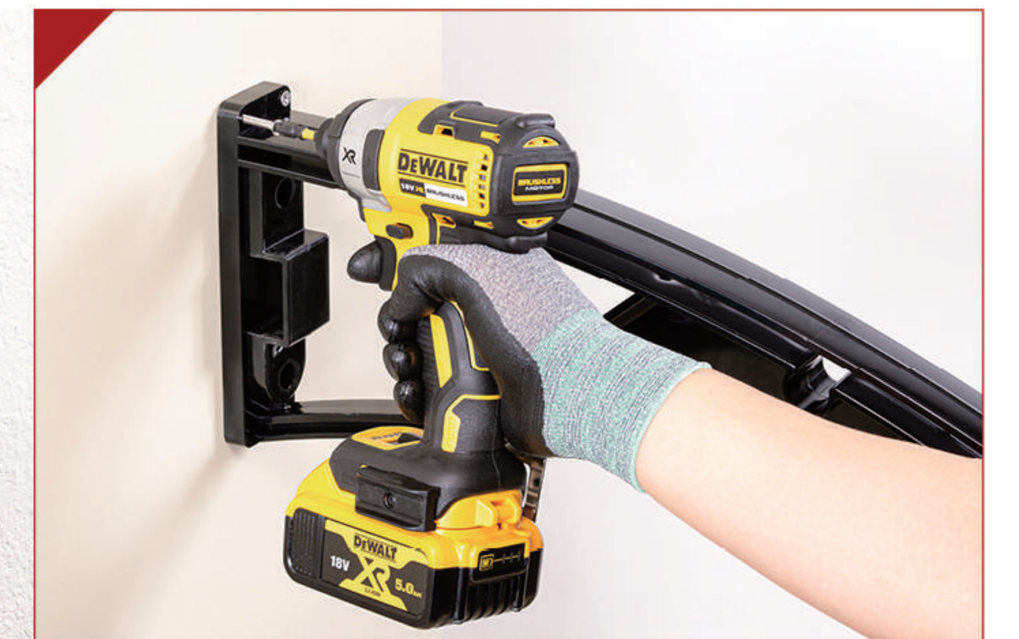
⚠ 1-4 나무로된 벽면 고정 예시(8)